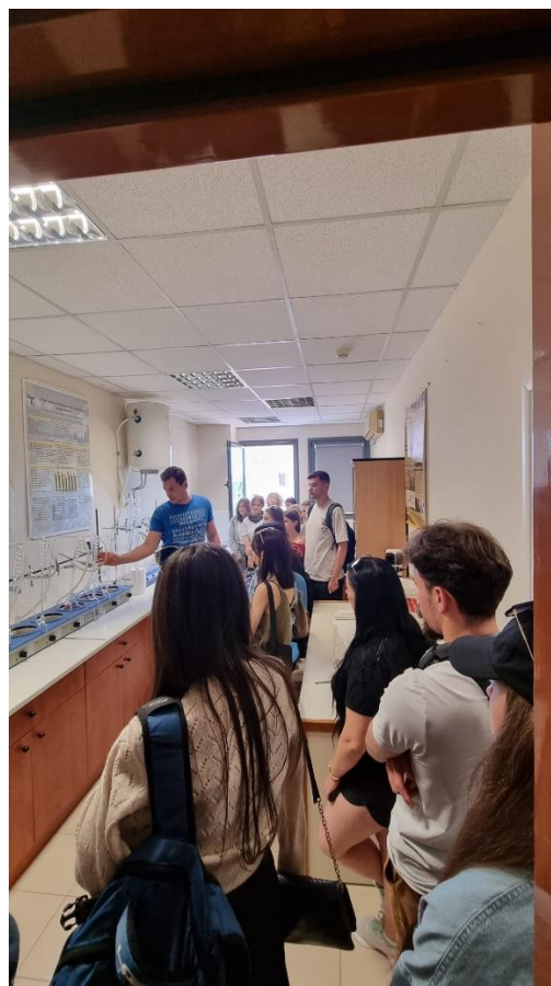
Aspecte din timpul vizitei la Departamentul Plante aromatice